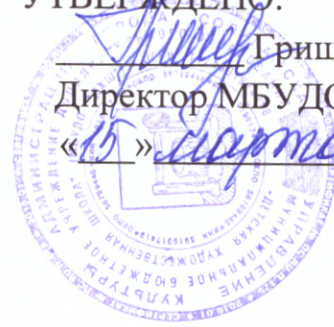
ГРАФИК вступительных испытаний май-июнь 2022 год.